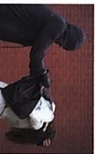
der Raubüberfall -überfälle [raup'y:ʊbɛfʌl]