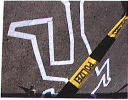
der Tatort -e [tʰa:rtɔrt]