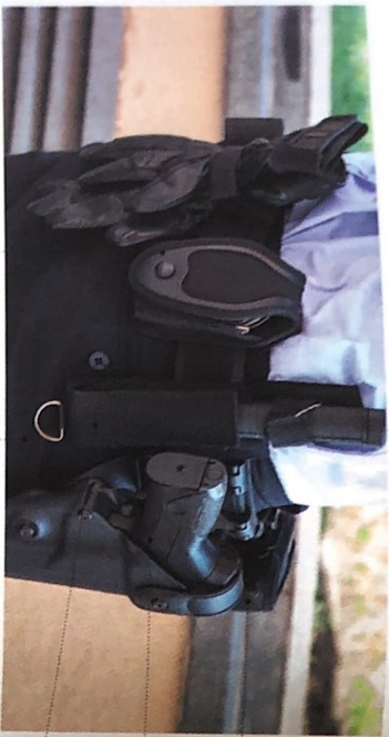
die Handschellen Pl [hantʃɛʌn]