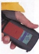
das LVS-Gerät -e [lɛˌlav ˈʁɛʒɛrɛt]