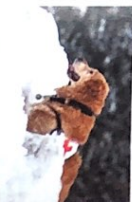
der Rettungshund -e [ˈrɛtʊŋshʊnt]