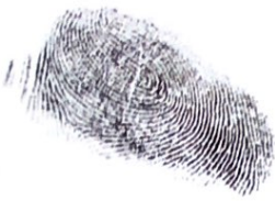
der Fingerabdruck -abdrücke [fɪŋgɐ'apdrʊk]