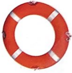
der Rettungsring -e [ˈrɛtʊŋsʁɪŋ]