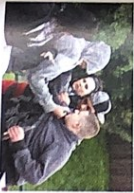
die Gewalt kein Pl [gɔ'valt]