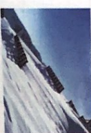
der Lawinenschutz kein Pl [laˌviːnʌŋʃʊtʃ]