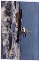
das Küstenwachboot -e [ˈkʏstɪnˈvɑxbo:t]