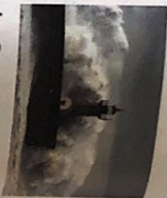
der Sturm Stürme [ˈfʊrm]