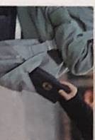
der Taschendiebstahl -diebstähle [taʃɛndi:p'ʃta:l]