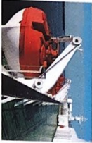
das Rettungsboot -e [ˈrɛtʊŋsbɔ:t]