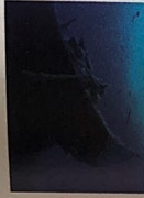
der Schiffbruch -brüche [ˈʃɪfbʁʊx]