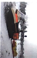
das Schneemobil -e [ˈʃnɛmobiːl]