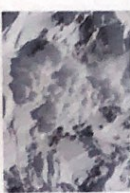
die Lawine -n [laˌviːnɐ]