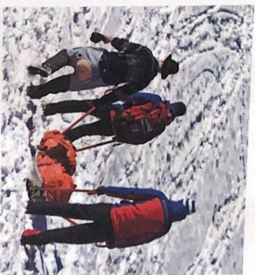
die Einsatzkräfte -kräfte [ˈaɪnʦatʃkrʰaft]