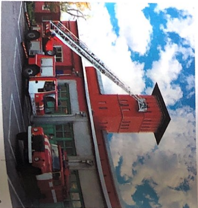
die Feuerwache -n [ˈfɔɪvʌxə]