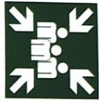
der Sammelpunkt -e [ˈzɑmˌplʊŋkt]