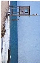
der Wachturm -türme [ˈvɑxtʊrm]