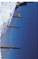
das Fangnetz -e [ˈfangnɛtʃ]