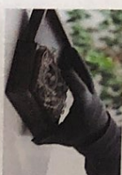
der Diebstahl Diebstähle [di:p'ʃta:l]