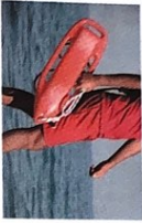
der Rettungs- schwimmer - [ˈrɛtʊŋsˈʃvɪmɐ]