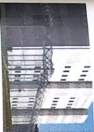
das Gefängnis -se [gɛ'fɛŋgnɪs]