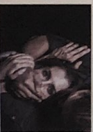
die Entführung -en [ɛnt'fʊ:ʁʊŋ]