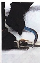
der Einbruch Einbrüche [aɪnbʁʊx]