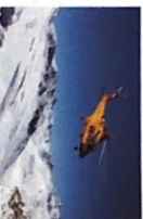
der Rettungshubschrauber - [ˈrɛtʊŋʃhʊpʃʰrʌʊbɐ]