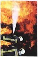
die Brandbekämpfung -en [ˈbrantbɛkɛmpfʊŋ]