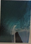
der Tsunami -s [tsuˈnɑmi]