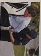
die Festnahme -n [fɛstnamə]