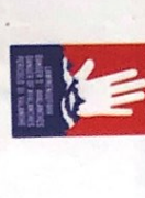
das Lawinenwarnschild -er [laˌviːnʌnˌvɔʁnʃɪlt]