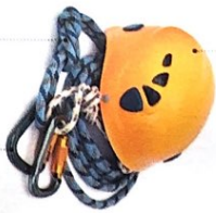
der Karabiner - [ˈkaraˌbɪnɐ]