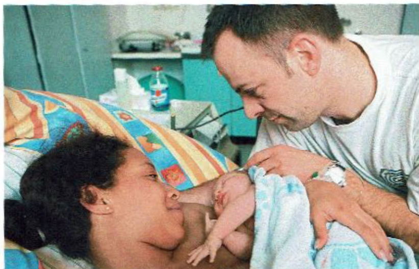
1 Eltern mit einem neugeborenen Kind

Wie kommt ein Kind auf die Welt? Was geschieht in den ersten Wochen und Monaten?