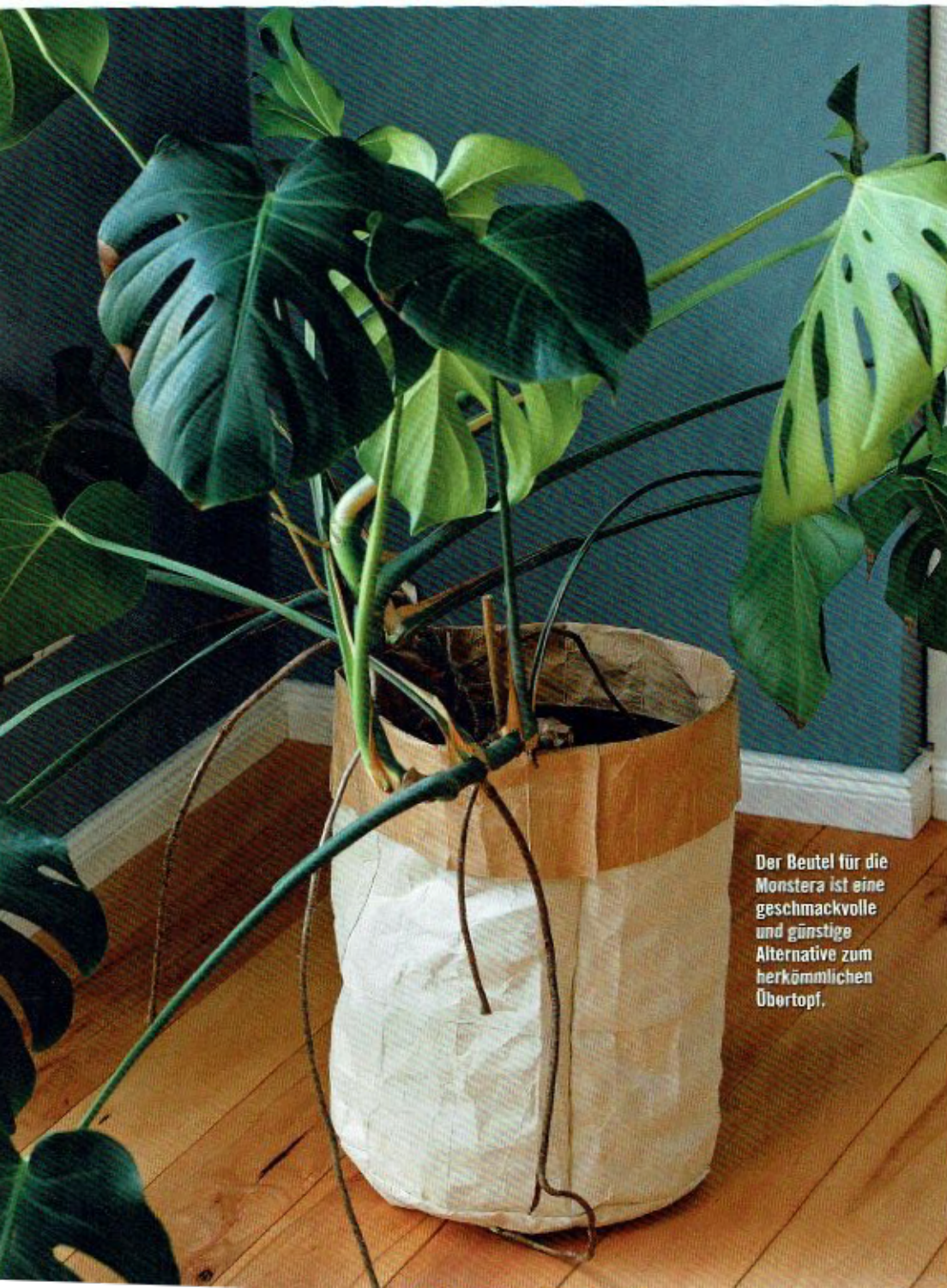
Der Beutel für die Monstera ist eine geschmackvolle und günstige Alternative zum herkömmlichen Übertopf.