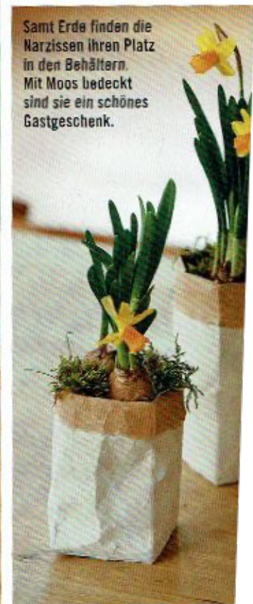
Samt Erde finden die Narzissen ihren Platz in den Behältern. Mit Moos bedeckt sind sie ein schönes Gastgeschenk.