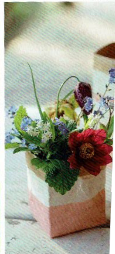
Die Blumentöpfe sind mit Wasserfarbe bemalt und machen sich als Tischdeko ganz prima