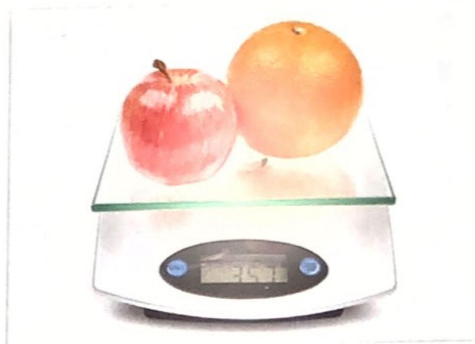
2 Eine Digitalwaage