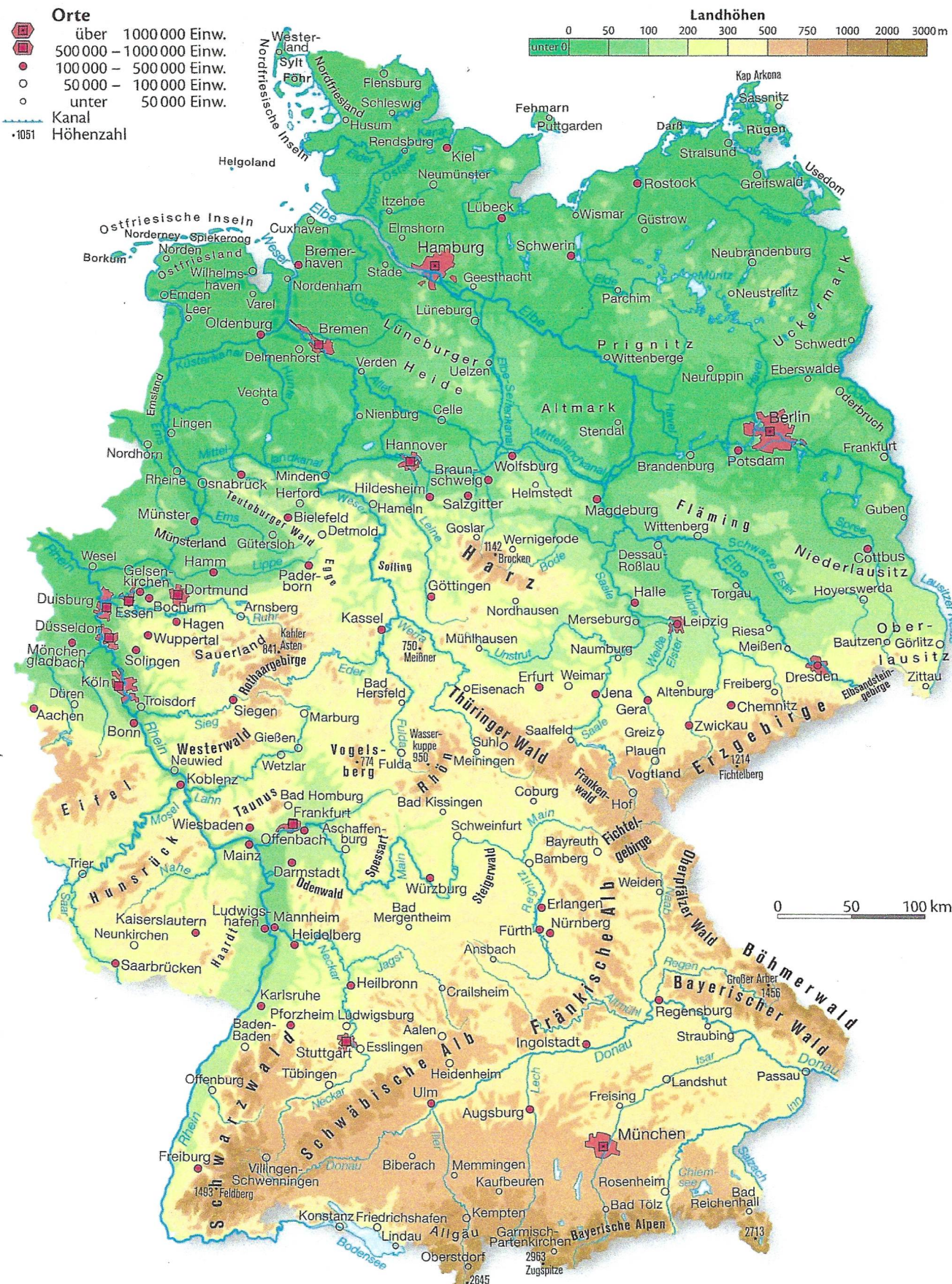
M1 Physische Karte Deutschlands

Die Karte findest du auch in deinem GL-Buch, S.66.