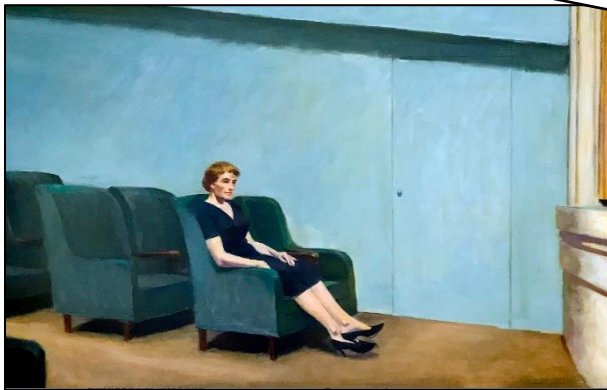
Abb. 2: Intermission von Edward Hopper, 1963