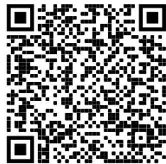
Werkesammlung des Museum of Modern Art in New York