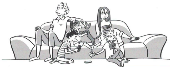
La famille Legrand

Max Legrand a onze ans et il a une sœur. Lucie a six ans. Les parents de Max et Lucie s'appellent Florence et Nicolas et ils sont très sympa. Le copain de Max, c'est Ben. Ben est souvent chez Max.