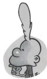
Titeuf > _____