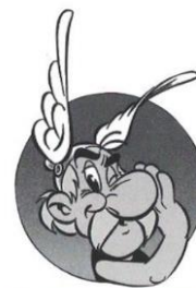
Astérix > _____