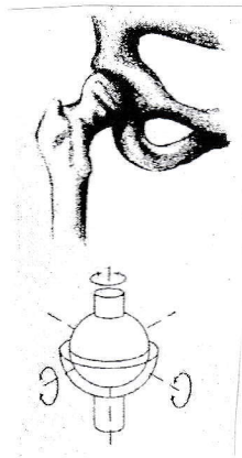
Kugelgelenk (z.B. Hüfte)