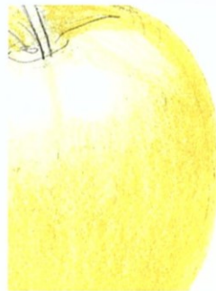
[27] Apfel mit Buntstiften koloriert

Mit Buntstiften kann man Gegenstände oder gezeichnete Räume natürlich noch „echter“ aussehen lassen. Dabei muss man den jeweiligen Farbton am Objekt erst bestimmen. Danach erzeugt man den gewünschten Farbton, indem man mit den Stiften verschiedene Farbschichten übereinanderlegt. So entstehen Mischfarben, da die untere Schicht sich mit der darüber liegenden zu einer neuen Farbe mischt. Das geht allerdings nur, wenn man nicht zu stark aufdrückt. Um Schatten farbig herzustellen, solltest du – soweit es geht – immer ein dunkles Blau anstelle von Schwarz verwenden, da Schwarz Farben schnell leblos und grau erscheinen lässt, während Blau lebendiger wirkt. Auch bei der Buntstiftzeichnung musst du die hellsten Stellen einfach weiß lassen („aus-sparen“) um eine gute Plastizität zu erreichen.