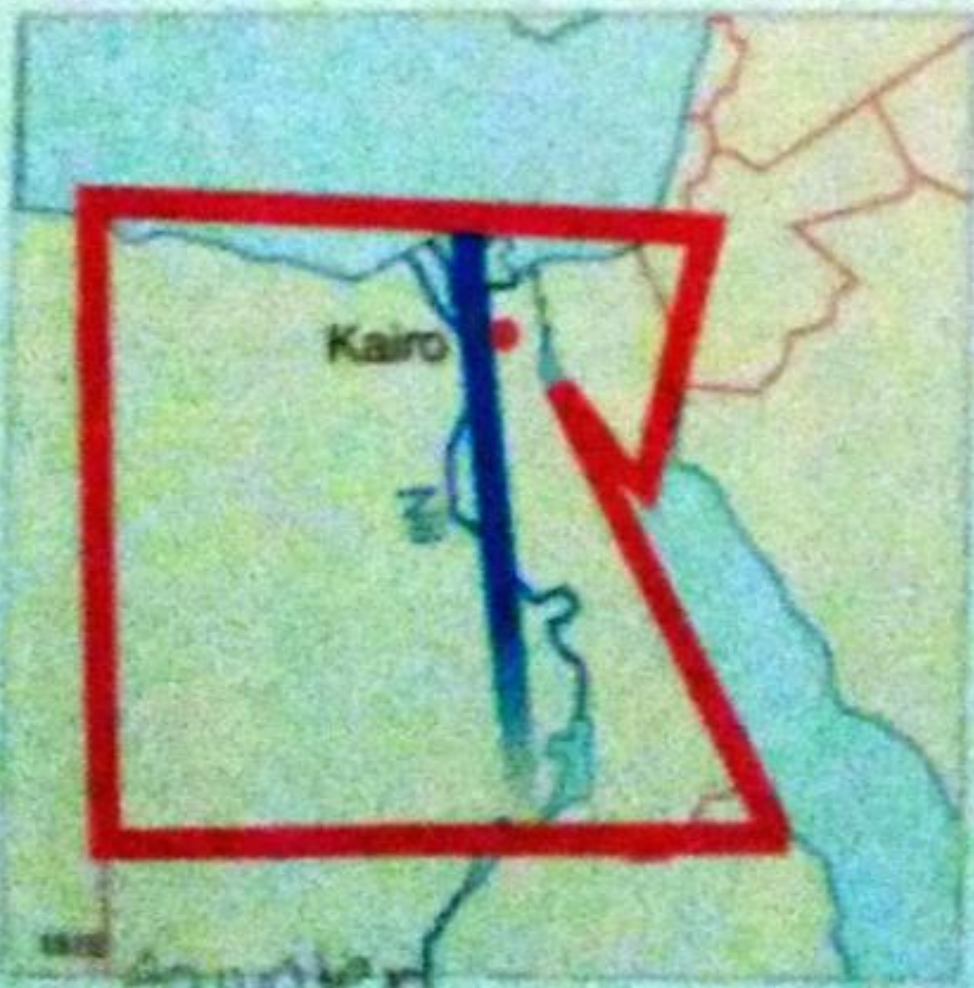
M2 Faustskizzen afrikanischer Staaten