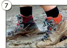
teenagers in the mud